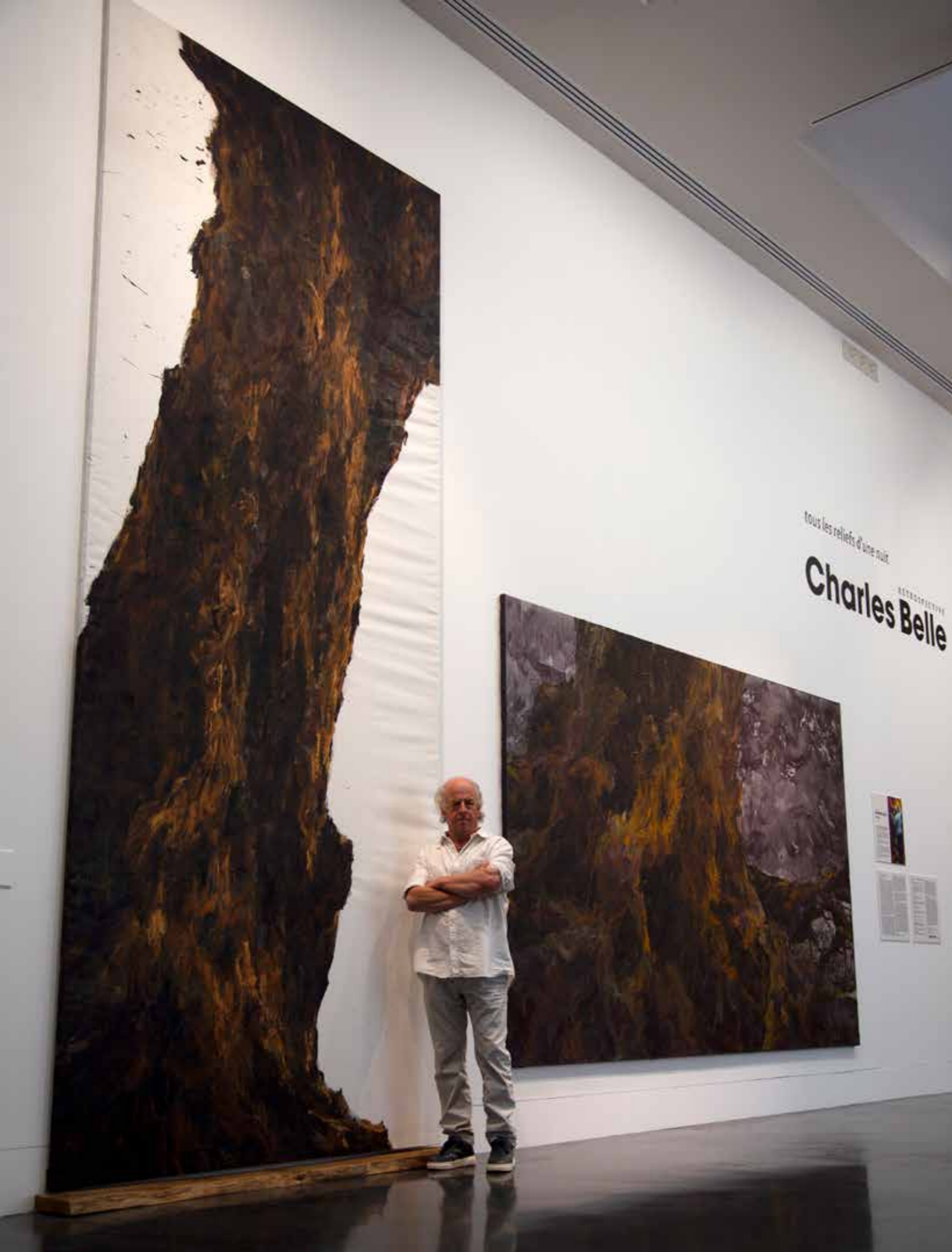
Rétrospective «Peindre» 2022 > 2023 | Exposition "tous les reliefs d'une nuit" Musée des beaux-arts et d'archéologie, Besançon (25) — Adagp, Paris 2023