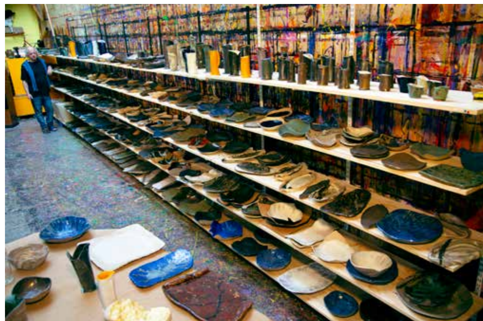
Charles Belle dans son atelier. Plus de 850 pièces uniques réalisées par Charles Belle — Adagp Paris, 2023