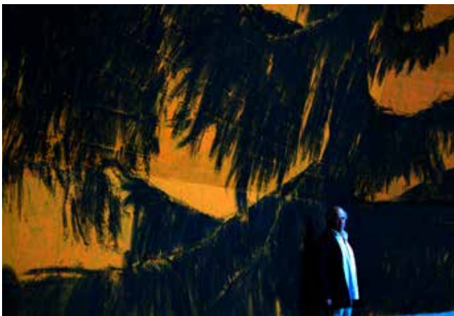
3. Charles Belle devant "sens figurés", 2017 (détail) acrylique et fusain sur béton, 18 mètres x 20 mètres Centre d'Art La Terrasse-Nanterre © charles belle