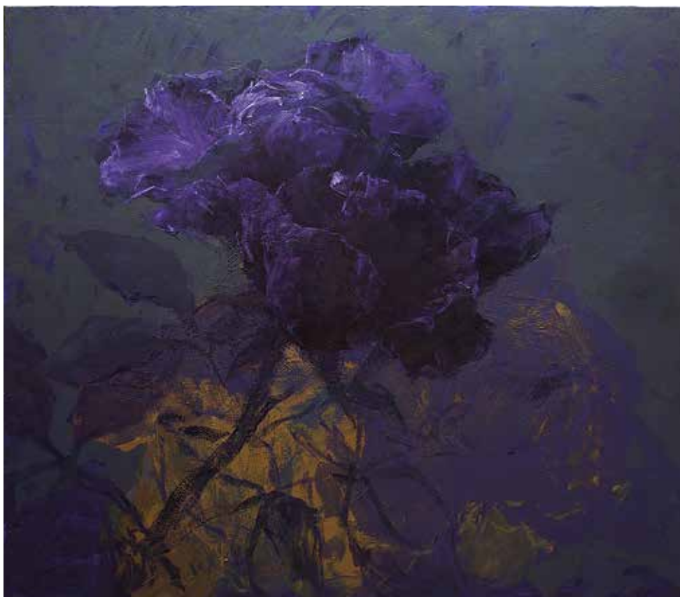
17. ce rêve profond, 2013, acrylique sur toile, 290 x 333 cm © charles belle