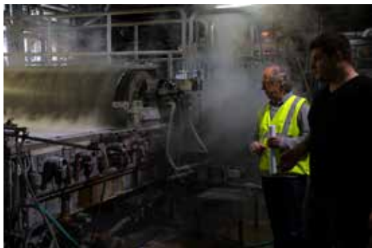
11. © noémie paya