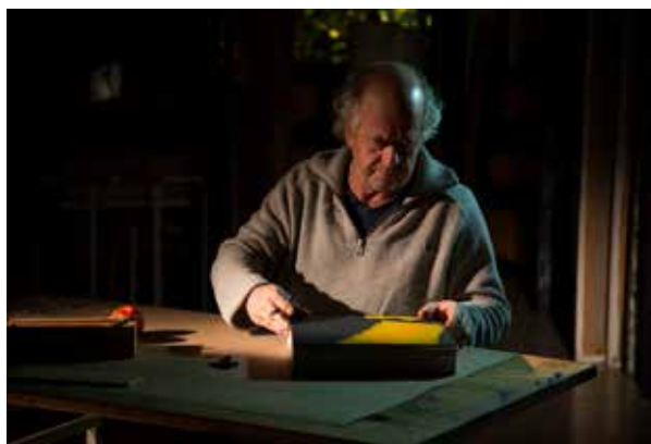
8. © noémie paya