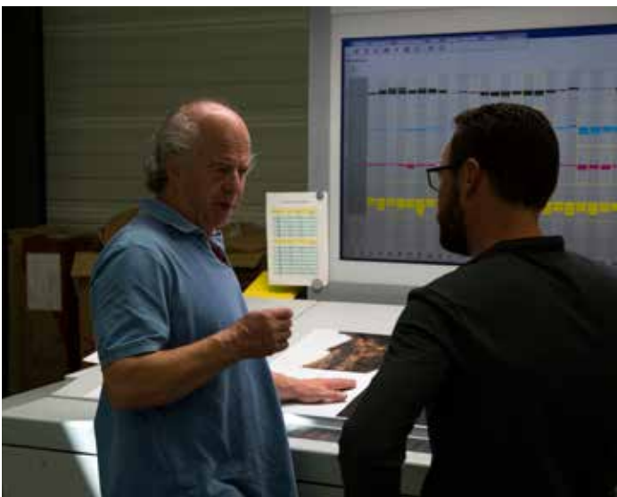
16. © noémie paya