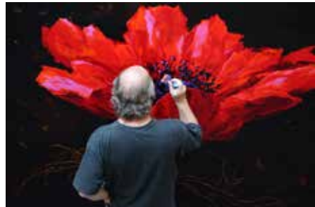
21. de profonds sourires, 2016 acrylique sur toile, 150 x 220 cm © noémie paya © charles belle