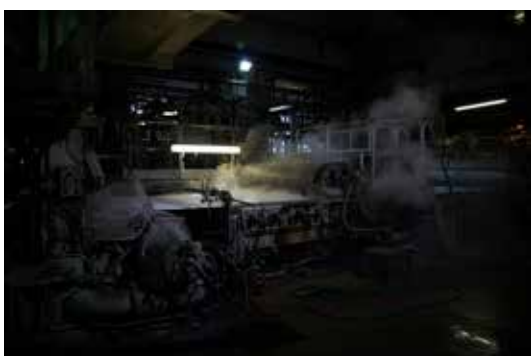
13. © noémie paya