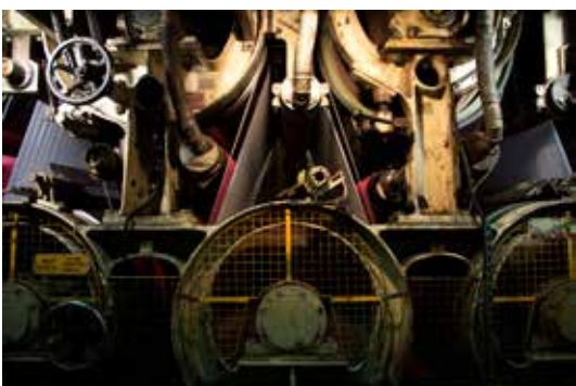
15. © noémie paya