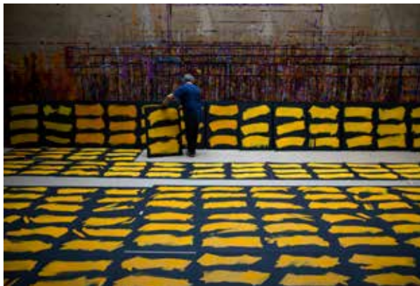
6. © noémie paya