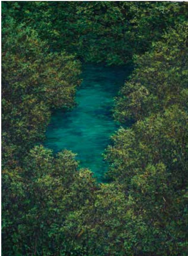
19. profondeur intime, 1990, huile sur toile, 276 x 202 cm © charles belle