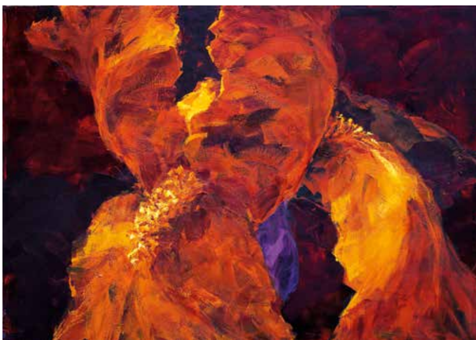
18. sans renoncer aux indices des iris, 1996, huile sur toile, 114 x 162 cm © charles belle