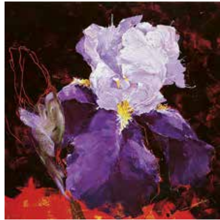
20. jouer ce personnage, 2004, huile sur toile, 175 x 175 cm © charles belle