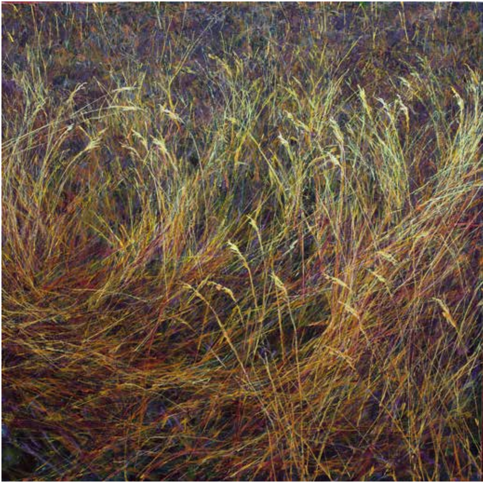
25. le peu que nous savons, 2017, acrylique sur toile, 175 x 175 cm © Charles Belle