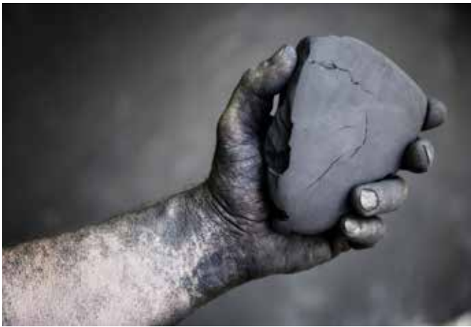
1. confiés à la forêt, Charles Belle, 2016