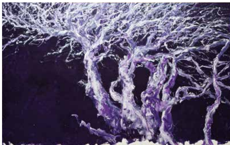
23. hêtre prémonitoire, 2010, acrylique sur toile, 237 x 377 cm © Charles Belle